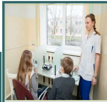
Имеется мини- бассейн.

Один из основных факторов оздоровления обучающихся и формирования у них культуры питания — организация качественного пятиразового питания с использованием современных методик детской диетологии. На пищеблоке работают высококвалифицированные специалисты, используется современное оборудование