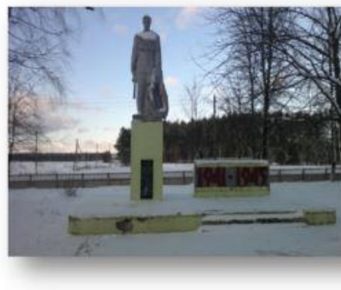
Фота 7. Помнік аднавяскоўцам, якія загінулі ў час Вялікай Айчыннай вайны, в.Забалацце