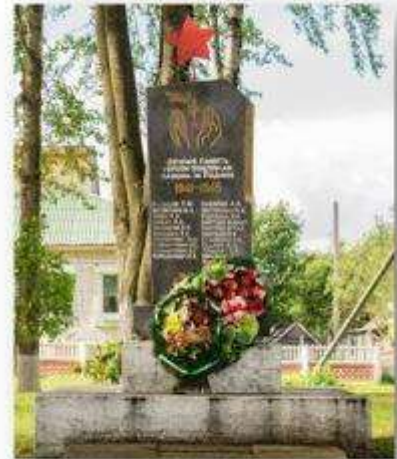
Фота 9. Помнік аднавяскоўцам, якія загінулі ў час Вялікай Айчынай вайны, аг. Сцешыцы