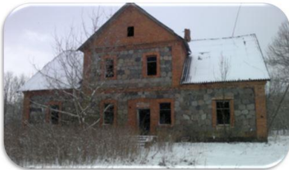
Фота 1. Сядзіба Багдановічаў, XIX стагоддзе