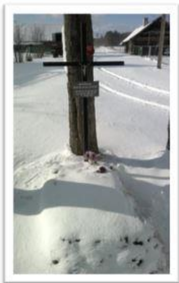
Фота 4. Магіла Фамы Бяспалава, салдата Першай сусветнай вайны