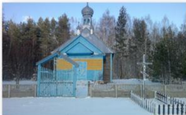
Фота 6. Спаса-Праабражэнская царква, в. Забалацце, XX стагоддзе