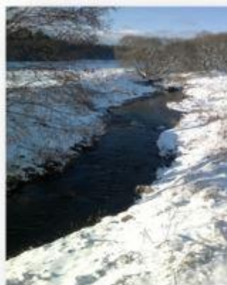
Фота 5. Рака Кабылянка