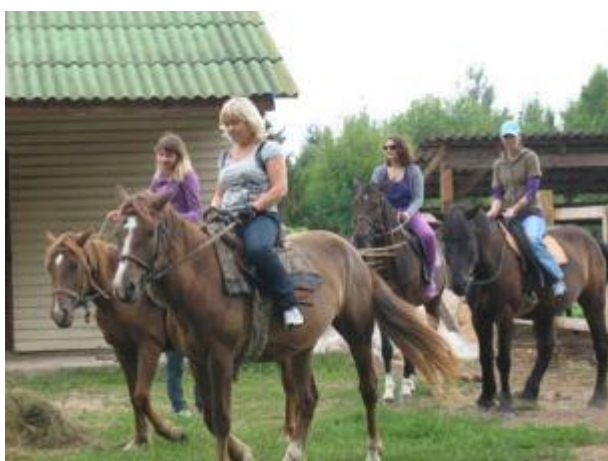
Фота 2. Конная база «Двор Старынкi»