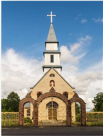
Фота 8. Касцел Перамянення Пана Езуса, аг. Сцешыцы, XX стагоддзе