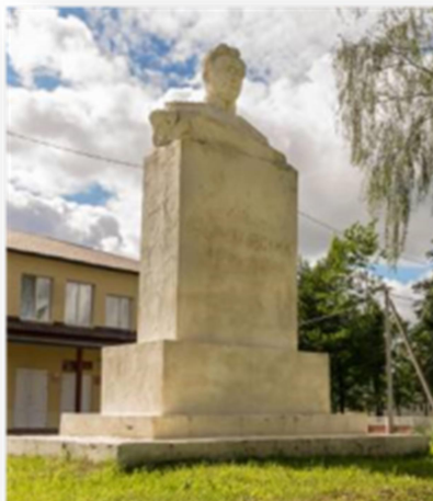
Фота 10. Помнік генералу савецкай арміі, двойчы Герою Савецкага Саюза Івану Данілавічу Чарняхоўскаму